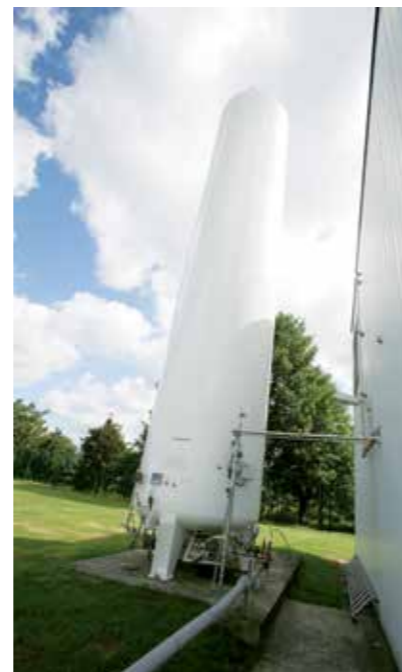
Datafer® is bij uitstek geschikt voor stationaire gastoevoerinstallaties, maar ook voor bundels en cilinderbatterijen.