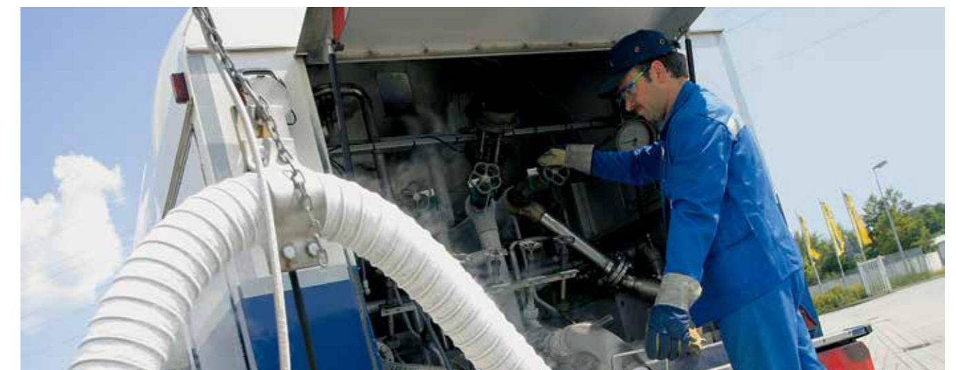
Stipte levering gewaarborgd: Datafer® genereert automatisch een bestelling, zodra een van tevoren vastgelegde minimumstand is bereikt.